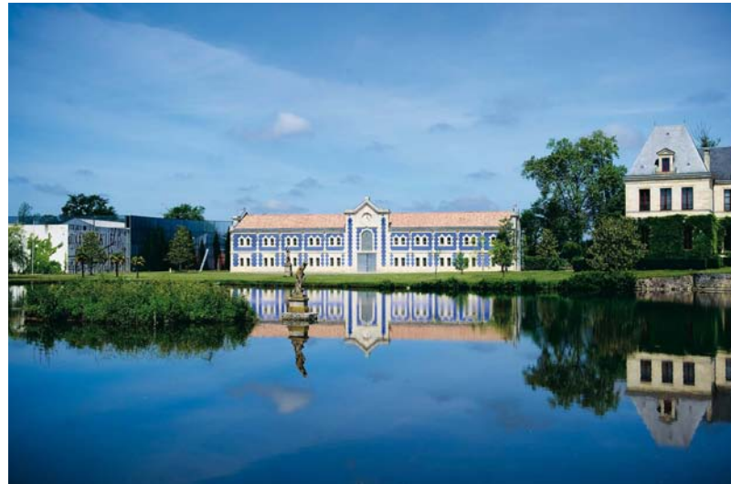
Château d'Arsac (Margaux)

aussi à l'image des châteaux bordelais. Regards intérieur-extérieur.