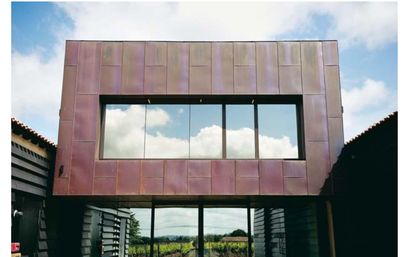
Château Petit-Village (Pomerol)