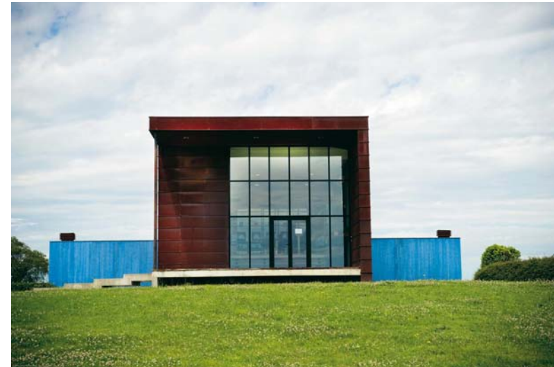
Château La Tour de Bessan (Margaux)