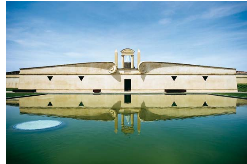
Château Pichon-Longueville Baron (Pauillac)